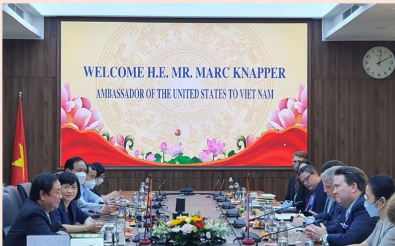
Bộ trưởng Nguyễn Xuân Cường tiếp và làm việc với tân Đại sứ Hoa Kỳ Marc Knapper

Việt Nam đã cho phép Hoa Kỳ xuất khẩu trên 170 loại hạt giống cây trồng và 06 loại quả tươi. Hiện, Bộ NN&PTNT đang phối hợp với Hoa Kỳ làm thủ tục mở cửa thị trường đối với quả bưởi chùm, chanh, quýt, đào/xuân đào, mận Nhật Bản và mơ có xuất xứ Hoa Kỳ. Để tiếp nối những nỗ lực đó, Bộ trưởng kiến nghị Ngài Đại sứ giúp thúc đẩy tiến độ, sớm hoàn thành mở cửa thị trường đối với trái bưởi