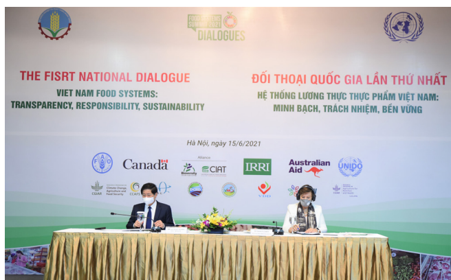
Thứ trưởng Bộ NN&PTNT Lê Quốc Doanh và bà Rana Flower - Trưởng Đại diện lâm thời FAO tại Việt Nam chủ trì hội nghị.

Mặc dù chịu tác động của đại dịch COVID-19 và biến đổi khí hậu, thiên tai, nhưng nông nghiệp vẫn duy trì tăng trưởng dương ở mức 2,68% trong năm 2020. Ngoài đảm bảo vững chắc an ninh lương thực, thực phẩm cho gần 100 triệu dân, kim ngạch xuất khẩu nông sản năm qua đạt 41,53 tỷ USD, tăng 3,3% so với năm 2019. Riêng 5 tháng đầu năm 2021, xuất khẩu nông sản của Việt Nam đã đạt 22,83 tỷ USD, tăng 30% so với cùng kỳ năm trước.