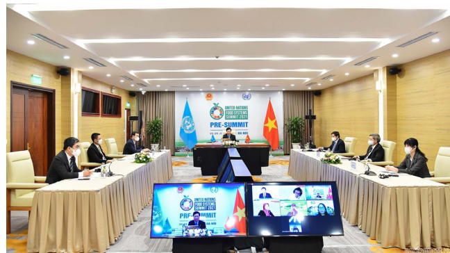
Toàn cảnh phiên họp tại đầu cầu Hà Nội

3. Xây dựng và cập nhật bảng cân đối dinh dưỡng quốc gia, làm cơ sở định hướng sản xuất, phân phối; tăng cường giáo dục để tạo thói quen ăn uống lành mạnh, cân đối dinh dưỡng, tiêu dùng tiết kiệm – tránh thất thoát