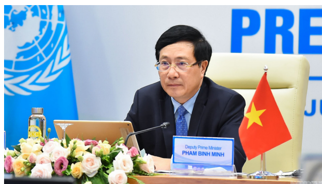
Phó Thủ tướng Phạm Bình Minh dự và phát biểu mở đầu Phiên họp Cấp cao về “Thúc đẩy sáng tạo ở các quốc gia để chuyển đổi các Hệ thống LTTP” ngày 27/7/2021 theo hình thức trực tuyến.

Phát biểu tại Phiên họp, Phó Thủ tướng Phạm Bình Minh nhấn mạnh công cuộc xóa đói giảm nghèo và phát triển bền vững trên toàn cầu dù đạt nhiều thành quả song vẫn phải đối mặt với nhiều thách thức lớn như hậu quả khó