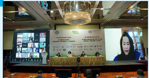
Toàn cảnh cuộc đối thoại quốc gia lần thứ Hai, ngày 16/7/2021 tại Hà Nội.

Việt Nam đặt mục tiêu trở thành quốc gia sản xuất và cung cấp thực phẩm minh bạch - trách nhiệm - bền vững, đáp ứng yêu cầu an ninh lương thực và dinh