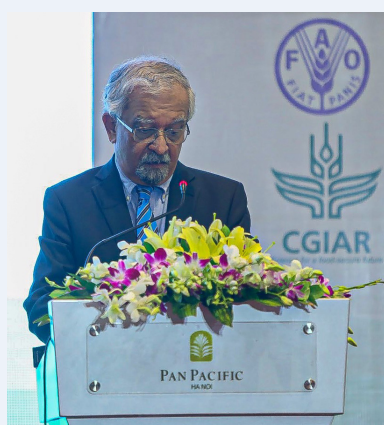
Điều phối viên thường trú LHQ tại Việt Nam Kamal Malhotra.

Việt Nam “Cần có tầm nhìn chiến lược định hướng để có sự chuyển đổi mang tính cách tân trong hệ thống lương thực để hướng tới chế độ ăn lành mạnh cho trẻ em, nâng cao nhận thức, đưa ra cam kết để có những hành động tập thể giữa các bên liên quan để đảm bảo chuỗi cung ứng bao