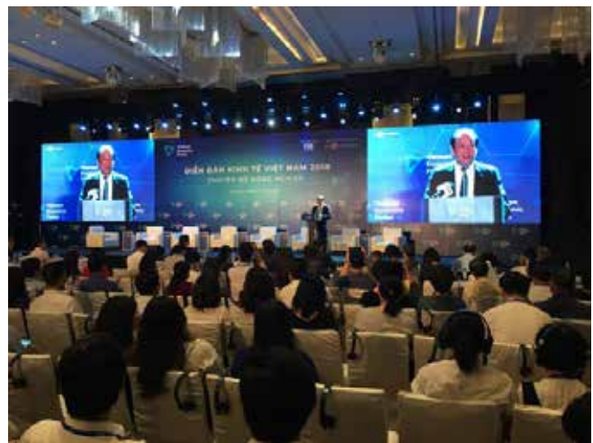
Bộ trưởng Mai Tiến Dũng phát biểu khai mạc diễn đàn

Nông sản Việt Nam có rất nhiều tiềm năng phát triển, nhưng cũng đang phải đối mặt với nhiều thách thức. Để giải quyết bất cập, điểm nghẽn, phải lấy thị trường làm mục tiêu, lấy tiêu chuẩn thị trường làm thước đo mới mở rộng được thị trường cho nông sản. Diễn đàn kinh tế Việt Nam (ViEF) 2018 với phiên mở đầu cho chuỗi các phiên chuyên đề trong khuôn khổ ViEF 2018 là chuyên đề Nông nghiệp với chủ đề "Giải pháp phát triển thương mại cho nông sản Việt".