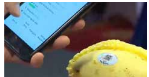
Quả “xoài blockchain” đã giúp HTX Mỹ Xương, Đồng Tháp giải quyết được bài toán về truy xuất nguồn gốc nông sản và bảo vệ thương hiệu.

Tuy nhiên, cũng theo đại diện IBL, dữ liệu đầu vào (thông tin về quá trình sản xuất xoài được blockchain lưu lại) vẫn phải nhập thủ công, vì thế độ minh bạch thông tin đầu vào hoàn toàn phụ thuộc vào người nông dân và HTX, như vậy chưa thể áp dụng IoT vào hệ thống này được.