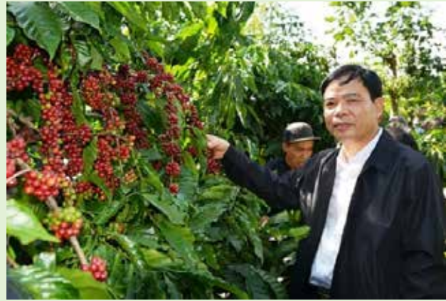
Bộ trưởng Nguyễn Xuân Cường đến thăm một số vườn cà phê của người dân ở huyện Lâm Hà, Lâm Đồng