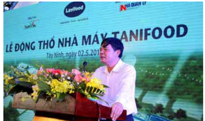
Bộ trưởng Nguyễn Xuân Cường phát biểu tại Lễ động thổ nhà máy Tanifood, Tây Ninh. Nhà máy Tanifood đi vào hoạt động vào cuối năm 2018 sẽ đảm bảo tiêu thụ toàn bộ nguyên liệu cho nông dân Tây Ninh tham gia chuỗi giá trị với 500 tấn nguyên liệu/ngày. Bên cạnh chức năng chế biến sâu để tăng giá trị cho nông sản, nhà máy này còn là mắt xích quan trọng trong việc thực hiện chuỗi giá trị nông nghiệp và thực hiện mô hình nông nghiệp sạch. Lavifood đã ký với tỉnh Tây Ninh về việc tái cơ cấu cây trồng trên diện tích khoảng 27.000 ha.

- Công ty cổ phần Thực phẩm xuất khẩu Đồng Dao đã khởi công Dự án Trung tâm Chế biến rau quả DOVECO Gia Lai. Đây sẽ là một trung tâm chế biến rau quả khép kín, từ việc thu mua nguyên liệu, chế biến sâu và hệ thống bán hàng trong nước cũng như xuất khẩu. Doanh thu hàng năm của Dự án dự kiến là 1.500 - 2.000 tỷ đồng, kim ngạch xuất khẩu đạt 70 -100 triệu USD.