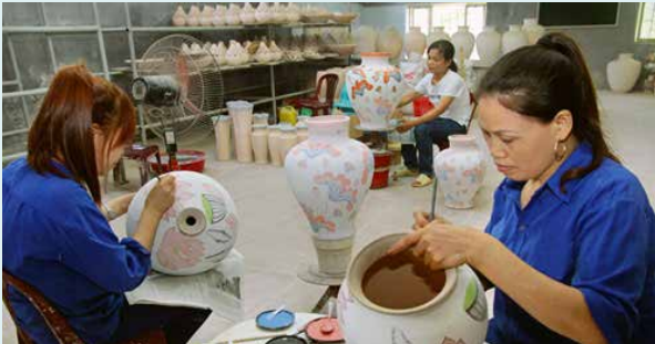
Chương trình sẽ triển khai thực hiện từ 8 đến 10 mô hình Làng văn hóa du lịch (Ảnh: Làng nghề Bát Tràng, Hà Nội).