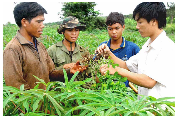
Chuyển giao kỹ thuật và chia sẻ tri thức cùng nông dân

Đối tượng chuyển giao, đối tượng nhận chuyển giao công nghệ