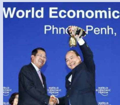
Thủ tướng nhận chuông nước chủ nhà WEF ASEAN 2018

Hội nghị WEF ASEAN (trước đây là Hội nghị WEF Đông Á) là một diễn đàn lớn và có uy tín trong khu vực, thu hút sự tham dự của lãnh đạo nhiều nước trong và ngoài khu vực, nhiều tổ chức quốc tế lớn và đông đảo lãnh đạo các tập đoàn hàng đầu thế giới. Việc tổ chức thành công Hội nghị này sẽ mang lại ý nghĩa nhiều mặt về chính trị, đối ngoại, kinh tế và quảng bá hình ảnh đất nước.