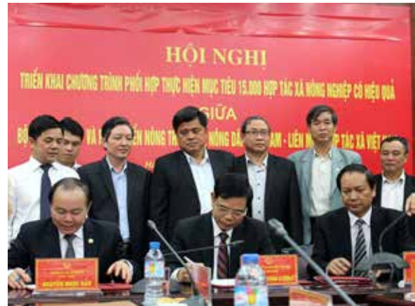
Lễ ký kết Chương trình phối hợp mục tiêu 15.000 hợp tác xã (HTX) có hiệu quả giữa Bộ Nông nghiệp & PTNT, Hội Nông dân Việt Nam (Hội NDVN) và Liên minh Hợp tác xã Việt Nam (LMHTXVN), ngày 12.4.2018.