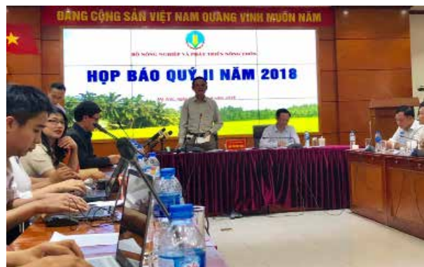
Bộ trưởng Volker Wising và Bộ trưởng Nguyễn Xuân Cường

Để đạt được các mục tiêu này, Bộ chủ trương tiếp tục đẩy mạnh cơ cấu lại, nâng cao năng suất, chất lượng hàng nông sản và hiệu quả sản xuất, kinh doanh. Theo đó, Bộ NN&PTNT sẽ tiếp tục rà soát quy hoạch, đánh giá lợi thế, tiềm năng để xây dựng cơ cấu sản phẩm theo 3 trục sản phẩm phù hợp với nhu cầu thị trường và thích ứng với biến đổi khí hậu là: Nhóm sản phẩm chủ lực quốc gia; nhóm sản