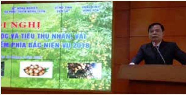
Bộ trưởng Nguyễn Xuân Cường phát biểu tại 'Hội nghị Thúc đẩy chăm sóc, tiêu thụ vải, nhãn tại một số tỉnh trọng điểm phía Bắc năm 2018'

Theo Bộ trưởng Nguyễn Xuân Cường, chỉ với diện tích trồng rau quả và trái cây khoảng 1,8 triệu ha, kim ngạch xuất khẩu năm 2017 là 3,45 tỷ USD. Tổng thương mại toàn cầu riêng về rau quả và trái cây khoảng 230 tỷ USD/ năm. Tốc độ tăng trưởng thương mại toàn cầu của rau quả hàng năm là 3 – 5%. Do đó, việc phát triển ngành rau quả và trái cây còn nhiều dư địa.