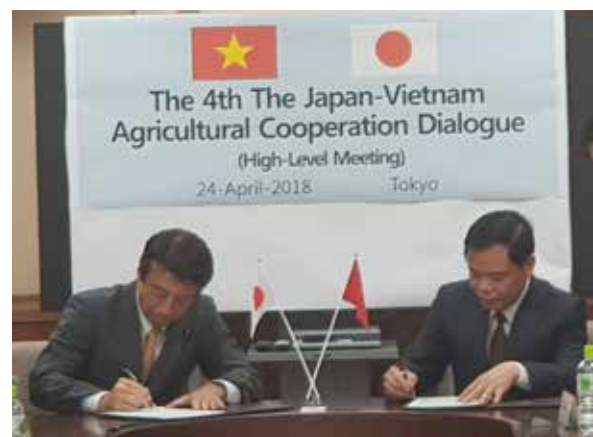
Bộ trưởng Nông lâm ngư nghiệp Nhật Bản ngài Ken Saito và Bộ trưởng Nguyễn Xuân Cường đồng chủ trì Đối thoại Nông nghiệp cấp cao Việt Nam – Nhật Bản lần thứ 4.

Cũng nhân dịp chuyến thăm này, bộ Nông nghiệp hai